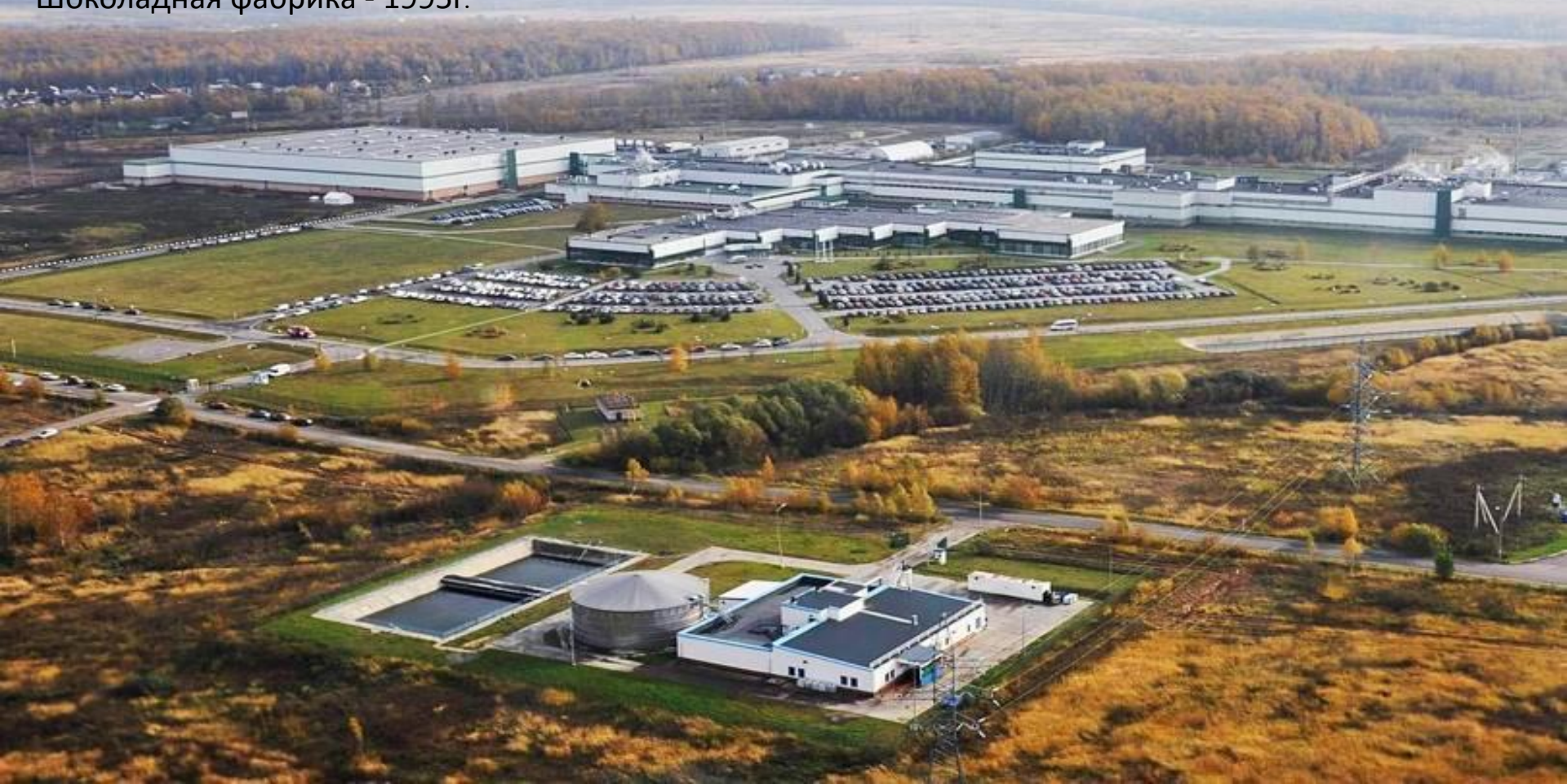
Ступино, Московская область, Шоколадная фабрика - 1995г.