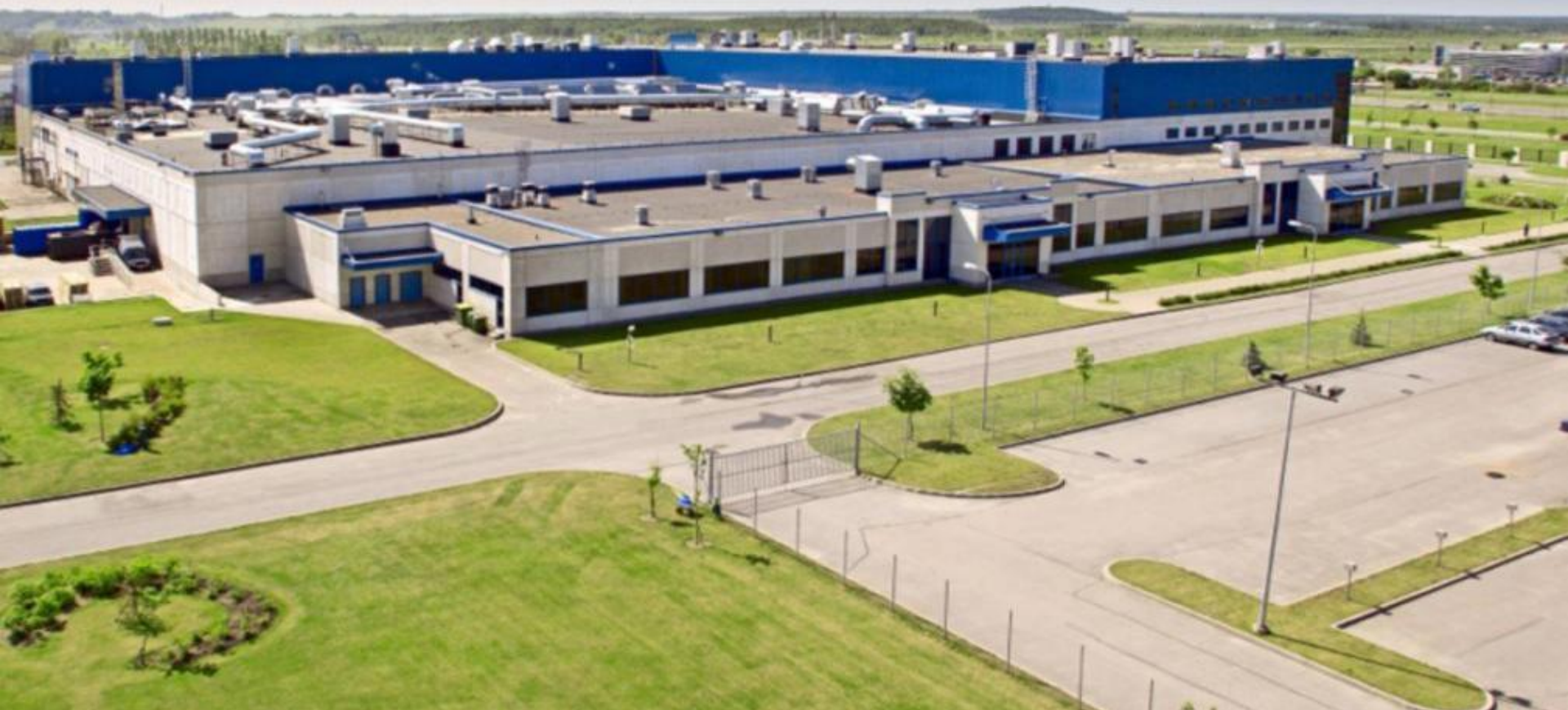
Санкт-Петербург Wrigley фабрика - 1998