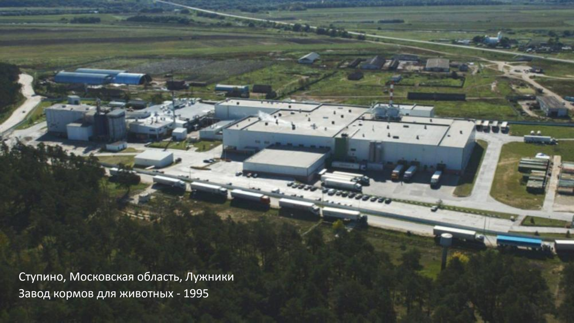
Ступино, Московская область, Лужники Завод кормов для животных - 1995