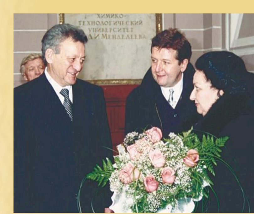
В стенах РХТУ - светило мировой оперы М. Кабалье