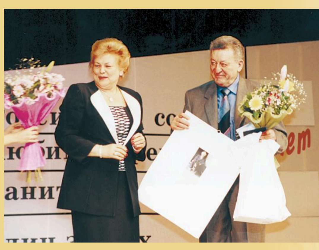
П.Д. Саркисов - победитель конкурса «Любимый ректор», 2002 г.

В 2006 г. Павел Джибраелович Саркисов был избран президентом Российского химико-технологического университета имени Д.И. Менделеева и возглавил Совет перспективного развития.