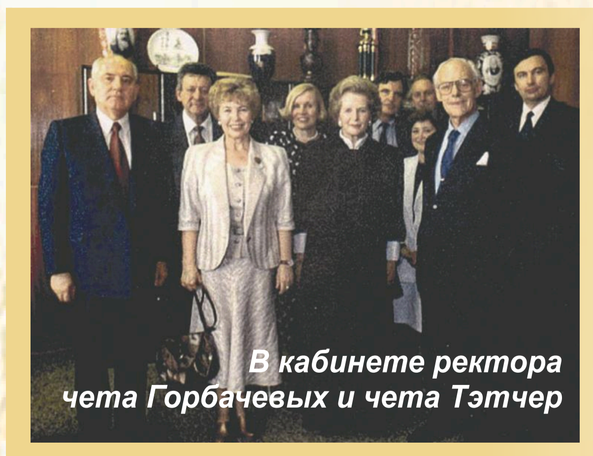
В кабинете ректора чета Горбачевых и чета Тэтчер