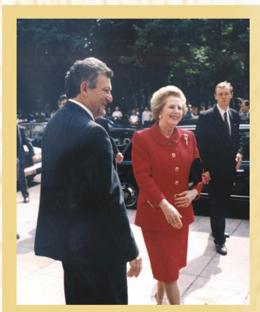
Встреча Почетного доктора РХТУ Маргарет Тэтчер