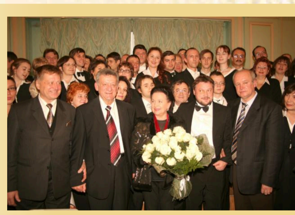
Галина Вишневская - Почетный доктор РХТУ им. Д.И. Менделеева