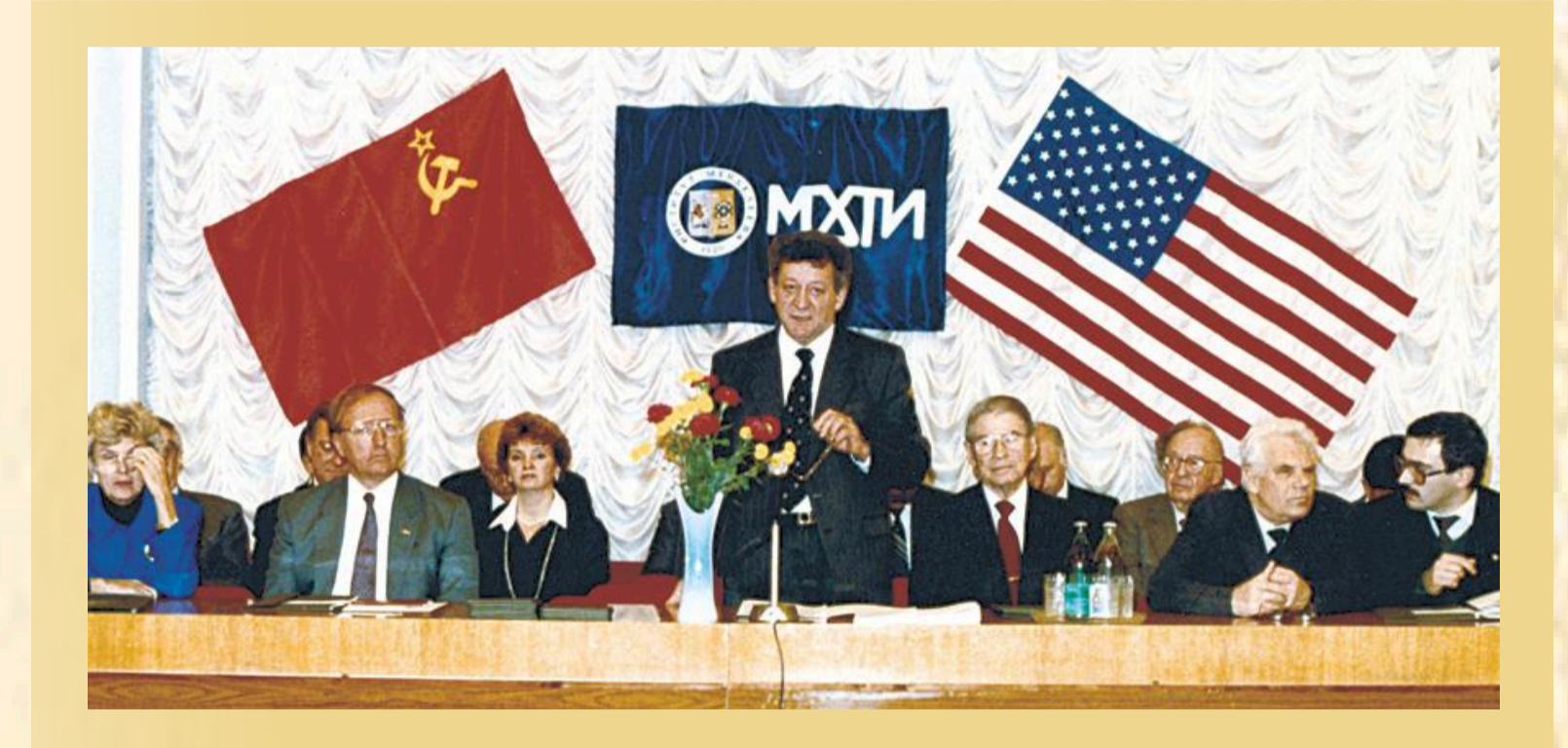
Визит делегации Ассоциации советов попечителей университетов и колледжей США в МХТИ им. Д.И. Менделеева, 1990г.