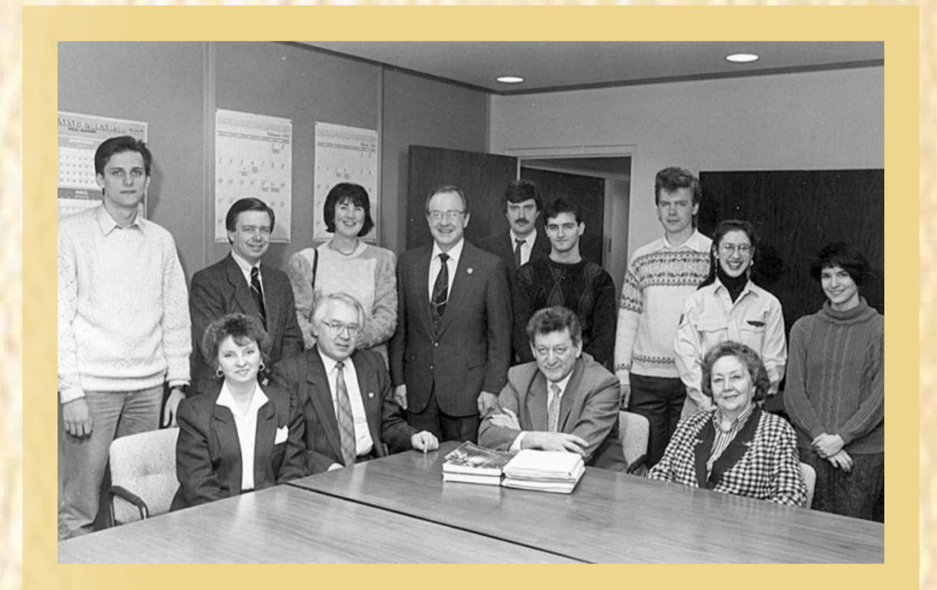
Визит делегации РХТУ им. Д.И. Менделеева в университет Боулинг Грин (США)