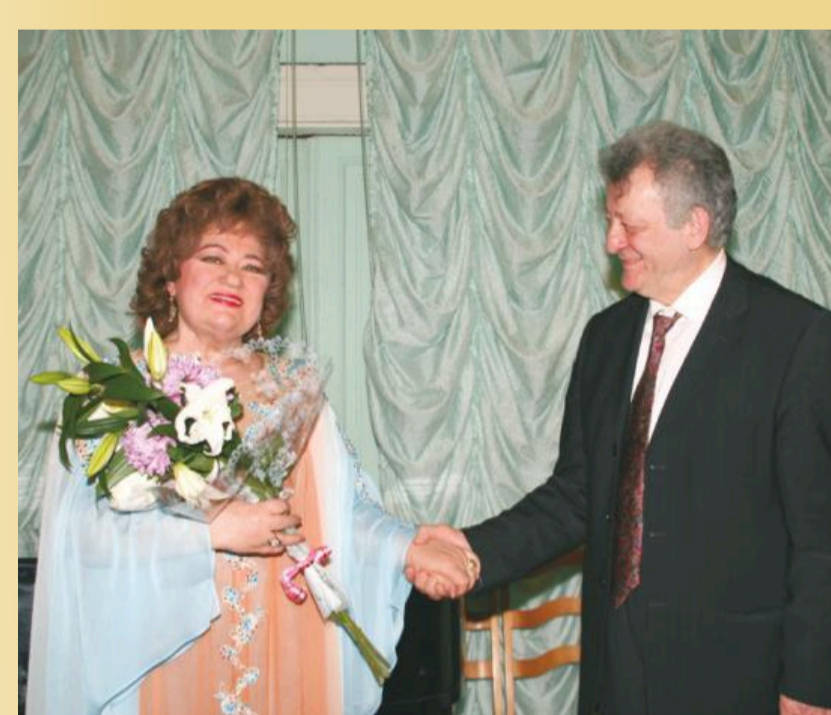
Для Вас поет звезда оперной сцены Мария Биешу