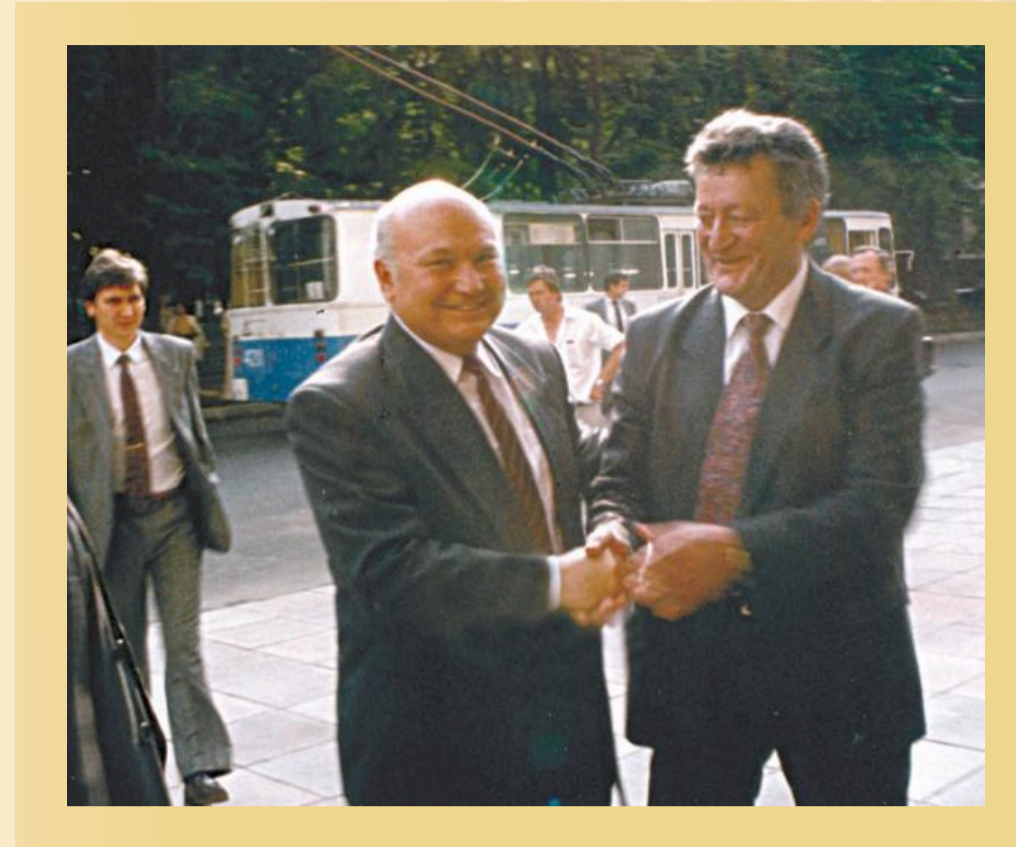
Ю.М. Лужков не только мэр, но и коллега-химик

Академик П.Д. Саркисов внес существенный вклад в развитие высшего, в том числе, химико-технологического образования в России. С момента создания в 1987 году учебно-методических объединений, он являлся председателем Учебно-методического объединения по образованию в области химической технологии и биотехнологии. Кроме того, он был членом бюро отделения физикохимии и технологии неорганических материалов РАН, заместителем председателя Совета ректоров г. Москвы, председателем координационного совета по химии Министерства образования и науки РФ, членом Экологического консультативного совета при мэре г. Москвы. Он был избран президентом Российского химического общества им. Д.И. Менделеева, Почетным президентом Союза научных и инженерных обществ России.