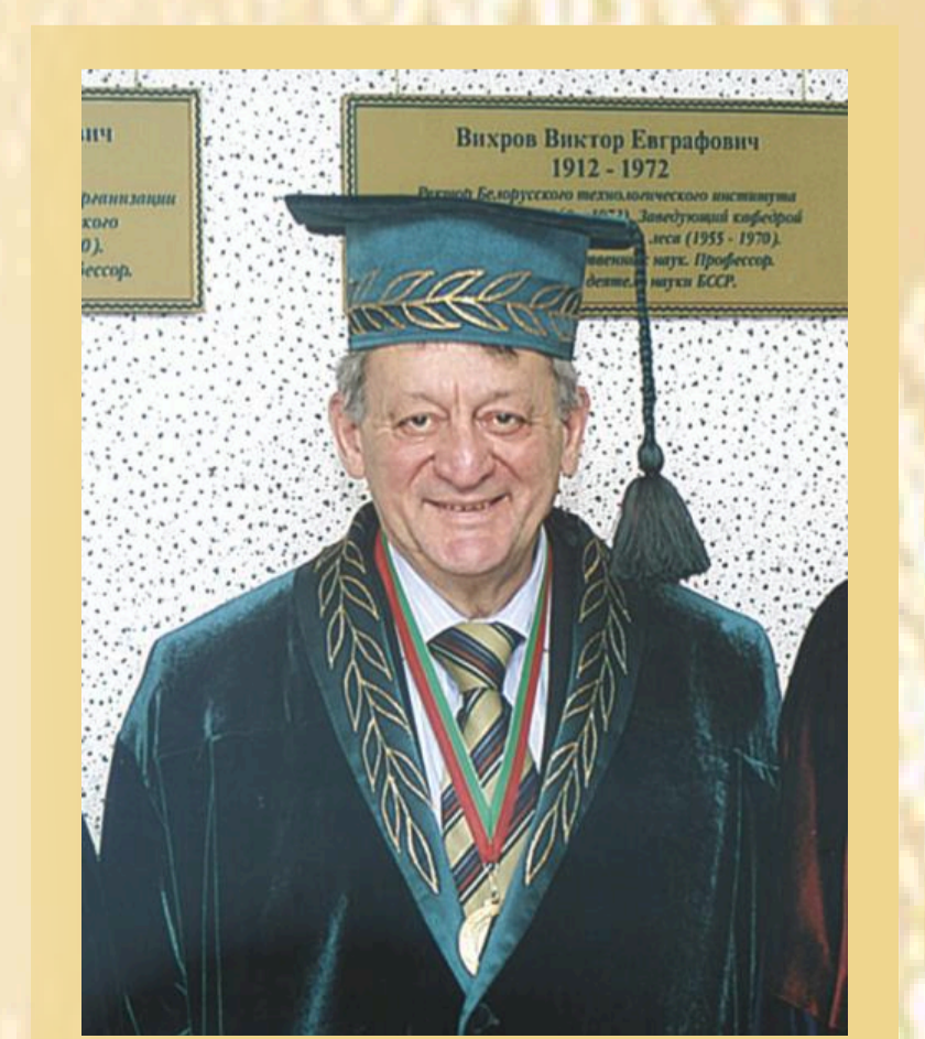
Почетный доктор многих Российских и зарубежных вузов

Среди них баронесса Маргарет Тэтчер, профессор Деннис Мэдоуз, океанолог Жак-Ив Кусто, лорд Джон Браун Мэдингги, певцы Хосе Каррерас, Ирина Архипова, Монтсеррат Кабалье, Галина Вишневская.