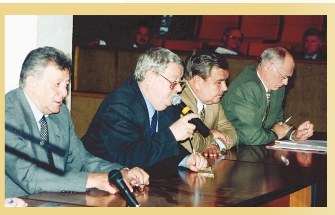
Заседание Совета ректоров г. Москвы, 2002 г. В президиуме заместитель председателя Совета П.Д. Саркисов, председатель Совета И.Б. Федоров, первые заместители Министра образования РФ А.Ф. Киселев и Г.А. Балыхин