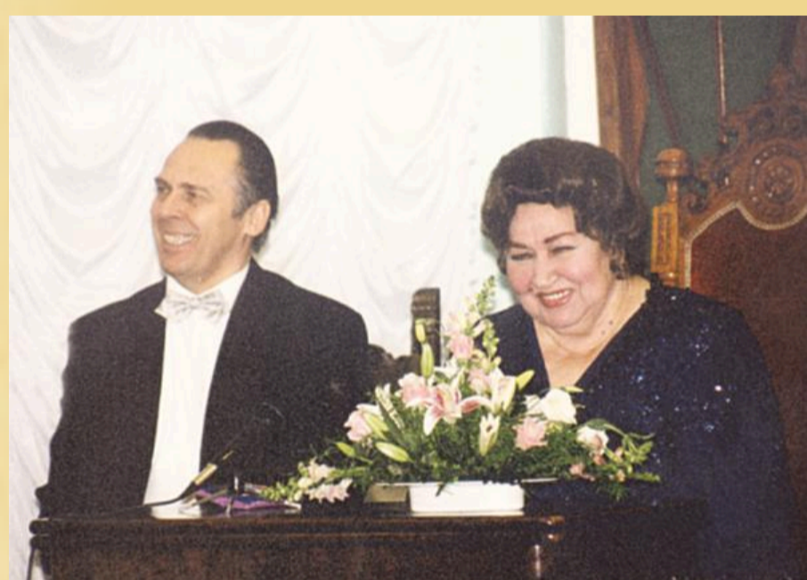
Церемония открытия «Музыкальной гостиной» Ирины Архиповой»