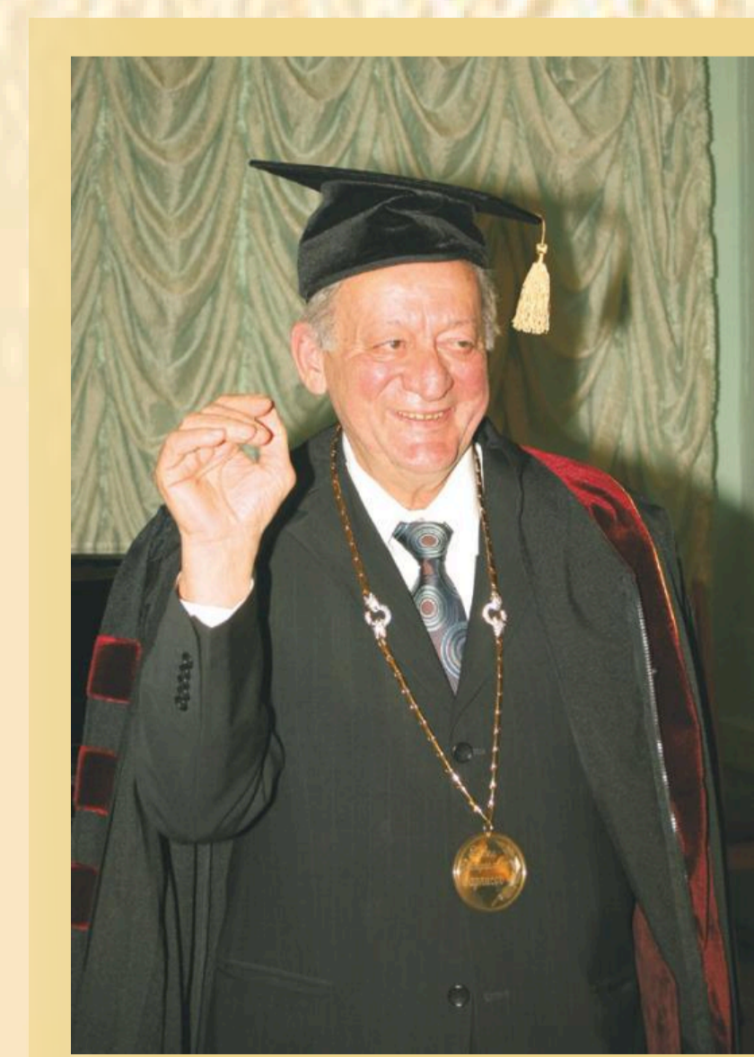
Первый президент РХТУ П.Д. Саркисов