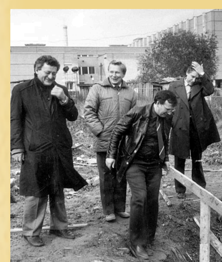
Закладка нового корпуса в Тушино