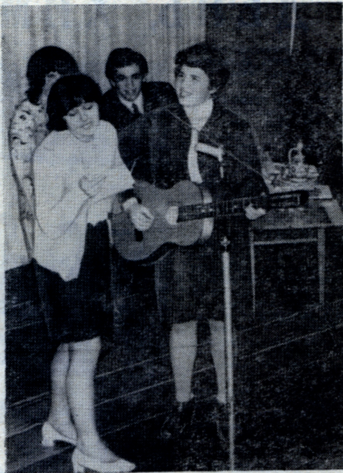
Выступают наши гости.

Торжественная часть прошла замечательно. Когда мы ехали сюда, мы даже не представляли, что все будет так хорошо организовано. До того