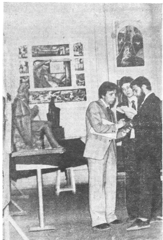
Выставка — это еще и общение, и обсуждение творческих планов.

знамя другого, подвергая его особому риску? И как этот другой мог согласиться на такое, не потеряв веры в князя и в правоту дела? И ведь если хотя бы часть воинов усомнилась в храбрости вождя, в его правоте, то вряд ли дружинники проявили легендарную стойкость. Но, с другой стороны, не объяснишь же каждому из 150000, что так надо делать, что ты имеешь право так поступить. Мы можем объяснить поведение Дмитрия тем, что переодевание предводителя войска и передача облачения и знамени другому лежали в области военных традиций русских дружин. Да и сам пуб-