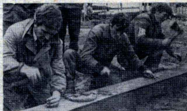
Лучший плотник... Кто же он?