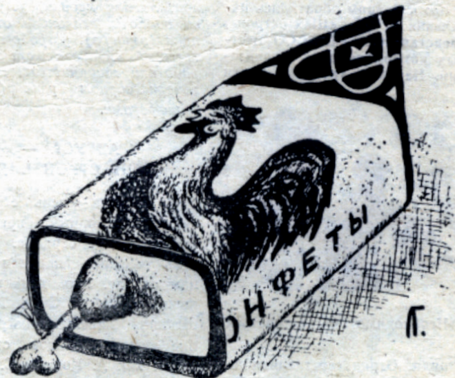
Рис. Л. Гулькина, А. Кривых