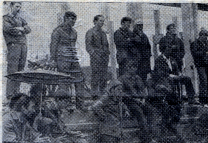
Зрители наблюдают за соревнованиями «лучший по профессии».

ран ССО М. Коцарь. Замерли бойцы, им, впервые выехавшим в составе ССО, посвящена эта торжественная минута. После клятвы традиционный «душ» для бойцов. Праздник набирает силу, теперь он переносится на стройку. Идет соревнование на звание «Лучший по профессии». Для того, чтобы стать «лучшим бетонщиком» необходимо залить определенную площадь пола с хорошим качеством. Лучшее из этой задачи выполнила тройка