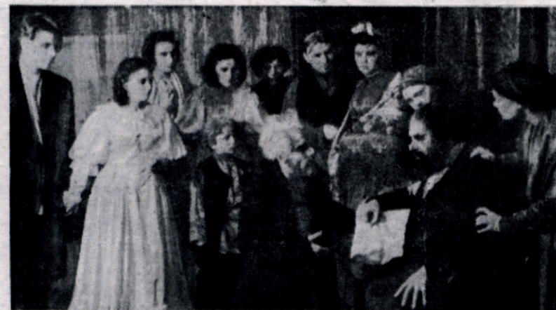
На снимке: сцена из 3-го действия пьесы А. Н. Островского «Бедность — не порок» в исполнении драмколлектива нашего института.