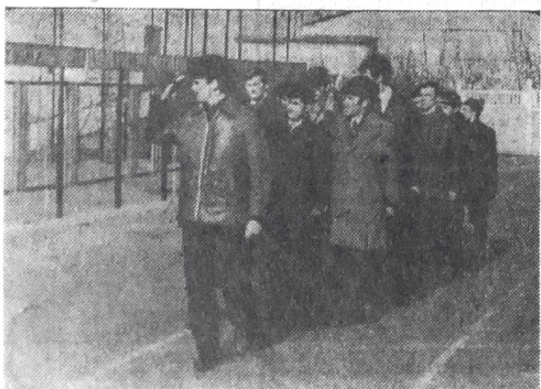
Обучение начинается с развода на занятиях.