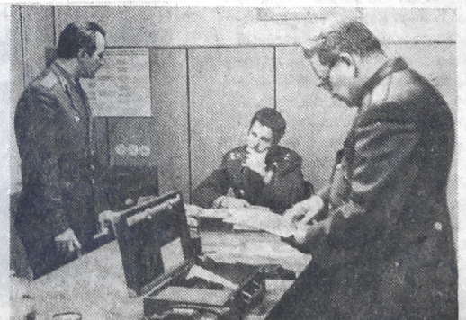
Идет подготовка преподавателей кафедры к занятиям.