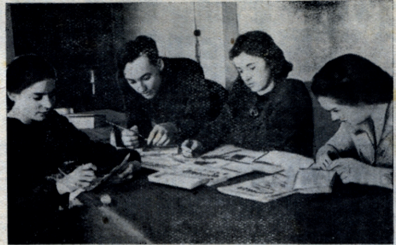
В проведенном конкурсе на лучшую стенную газету института стенгазета неорганического факультета «Молодость» заняла первое место. НА СНИМКЕ: члены редколлегии стенгазеты «Молодость» за работой над номером.

Н. Васильев. Америка с черного хода. М. Советский писатель, 1951 г., 355 стр.