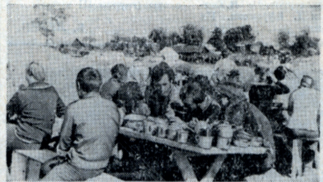
Для того чтобы боец работал, его надо вкусно кормить. 2-я заповедь завхоза.