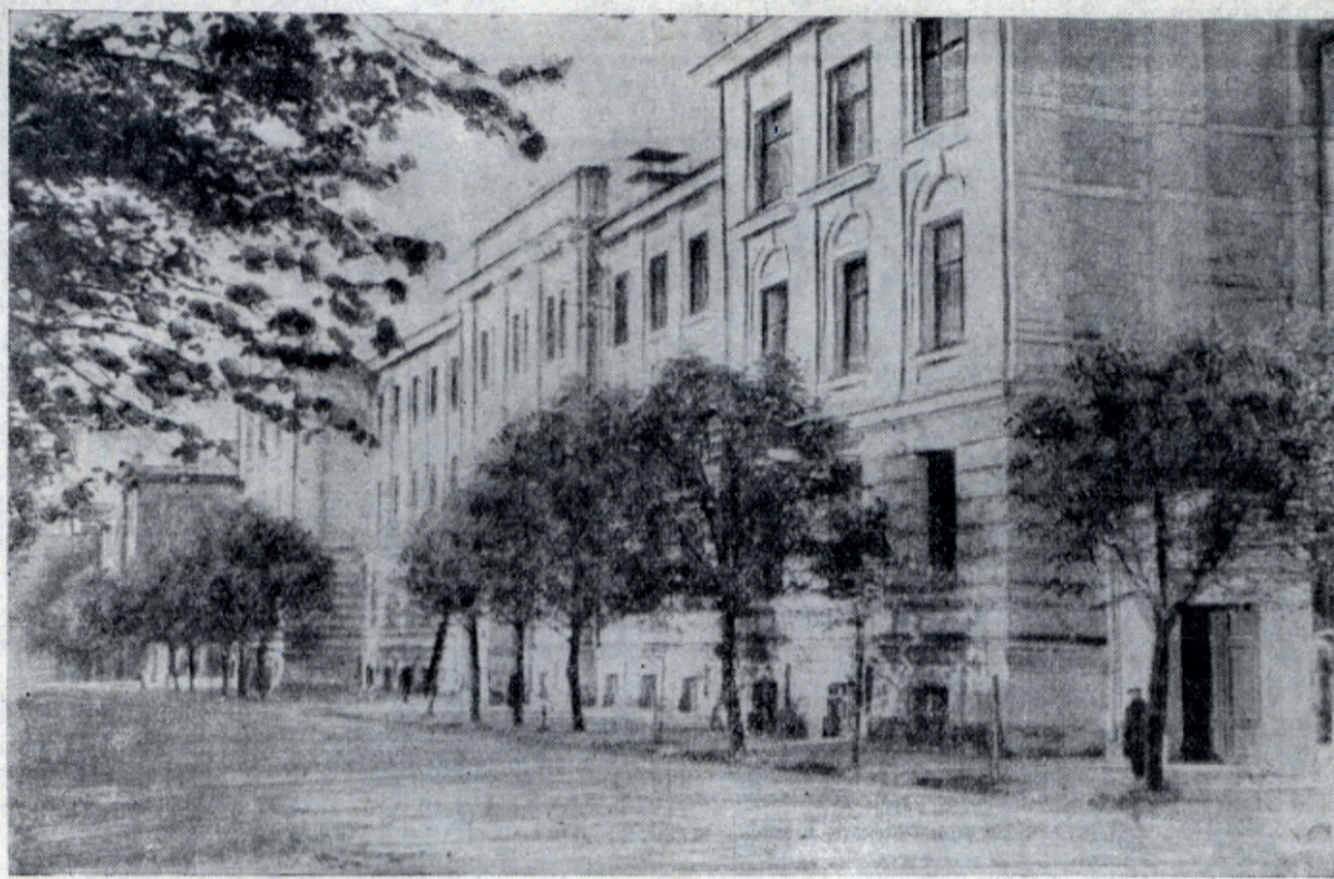
Московский ордена Ленина химико-технологический институт имени Д. И. Менделеева.