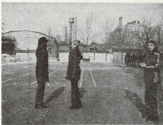
На военной кафедре. Начало занятий.