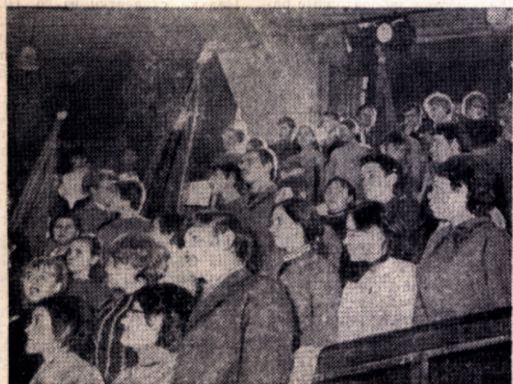
Комсомольца МХТИ в Большом актовом зале.