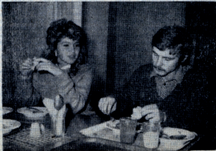
Столовая в Тушине, I этаж.

— Одной из причин существования всех этих проблем, как говорил ректор института на прошедшей профсоюзной конференции, является отсутствие