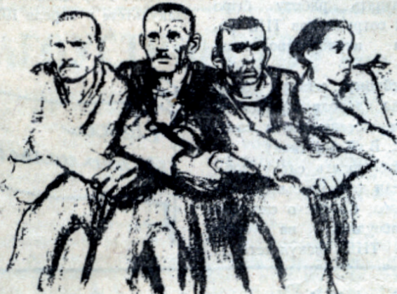
«Мы защищаем Советский Союз!»

художницы, является предметом специального изучения. Почти 20 лет тому назад ушла из жизни Кэте Кольвиц. Однако с течением времени все яснее видно величие ее личности, ее влияние на развитие современного изобразительного искусства социально-критической направленности, новаторство и актуальность ее работ.