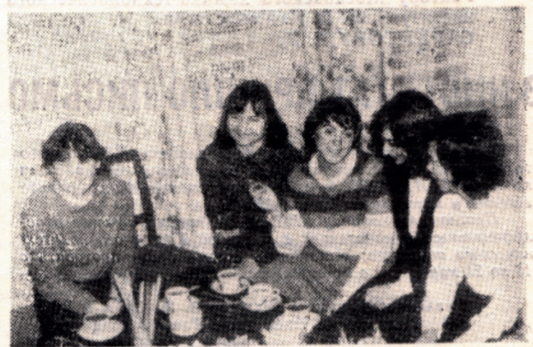
На одном из заседаний Интерклуба в Тушине.