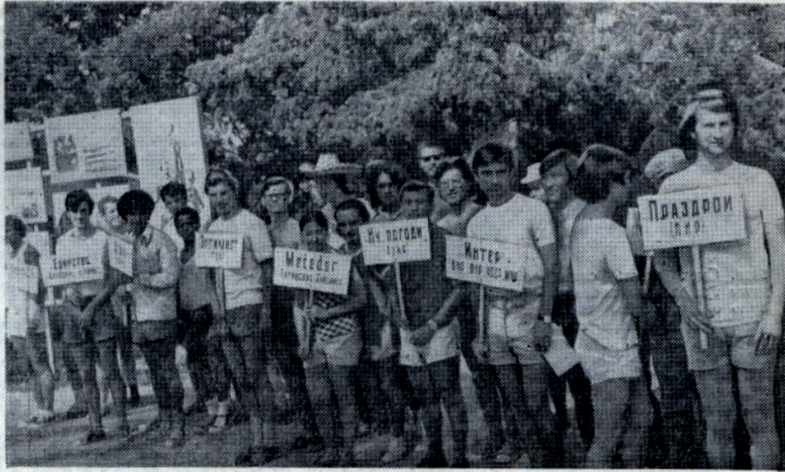
Интернациональный студенческий лагерь «Буревестник-74». Летом этого года здесь провели свои каникулы почти 350 студентов, аспирантов и стажеров из 36 стран мира.

Для руководства жизнью лагеря был избран Интернациональный Совет дружбы.