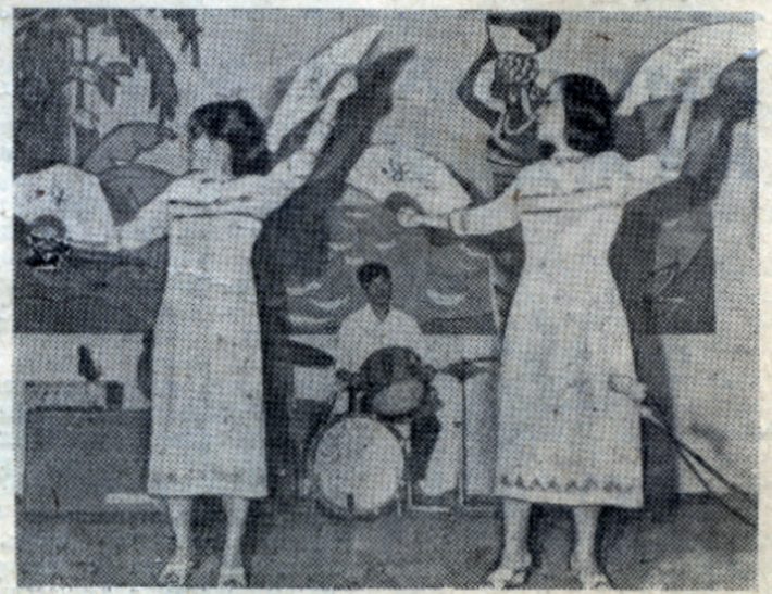
Материал полосы готовили: И. Ярошенко, О. Егорова (Т-41), Л. Сигрианская (Н-31).

«Интернациональные концертные вечера, проводимые в ИСЛ «Буревестник-2», являлись массовыми мероприятиями. Все концерты проходили в сопровождении вокально-инструментальных ансамблей совет-