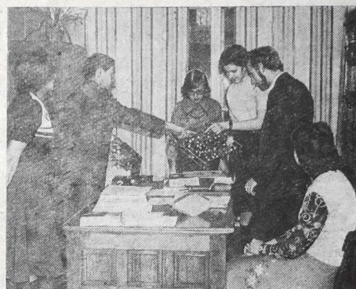
Научной работе и студенты, и преподаватели уделяют много времени и внимания.