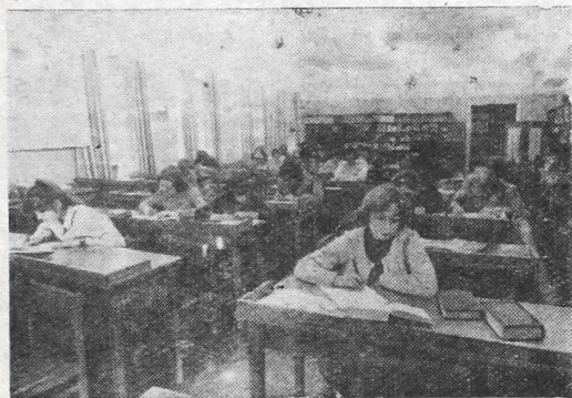
Наша библиотека признана одной из лучших среди вузовских библиотек г. Москвы.