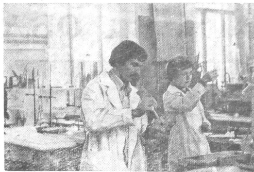
Кончился третий трудовой. Снова спешим на лекции, в лабораторию...—в институт.