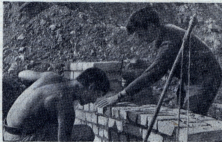
Так было выложено 750 кубометров кладки.

В. ГАВРЮШЕНКО, начальник Сорского строительного управления.