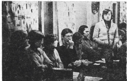
«Я русский бы выучил только за то, что им разговаривал Ленин».