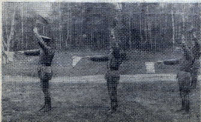
Сигналы — основ управления.