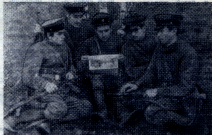
Агитатор за работой.

В. ТЕРЕХОВ, старший преподаватель, подполковник.