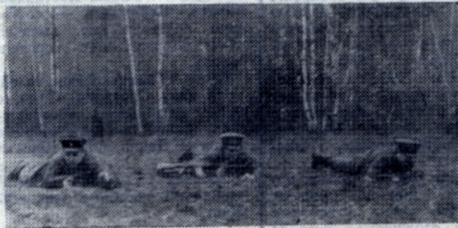
По-пластунски — вперед!

...Прижимаюсь плотно к земле... И неожиданно вспоминаю рассказ отца, как в сорок пер-