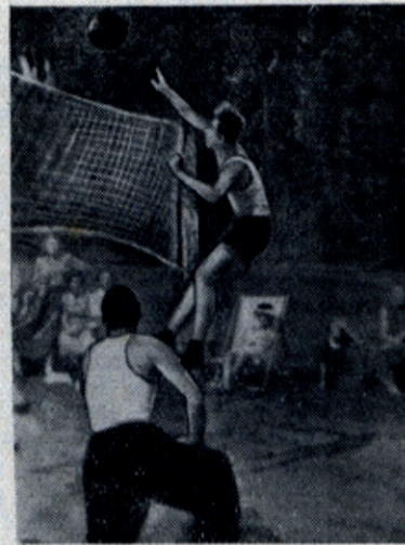
Момент игры в волейбол между мужскими командами волейболистов летнего спортивного лагеря студентов нашего института.