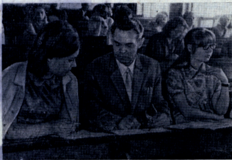
показали на экзаменах прочные теоретические знания, глубокое понимание разработанной XXIV съездом КПСС экономической политики партии в современных условиях.

Конечно, такие нерадивые, недобросовестно изучающие общественные науки, исчисля-