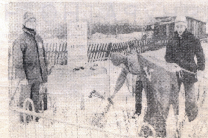
Участники похода возлагают цветы к памятнику погибшим героям.