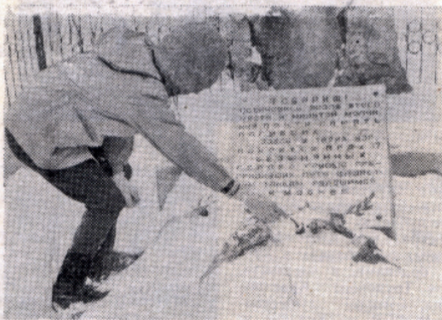
Это памятник 17 безымянным героям, преградившим путь фашистским танкам, рвавшимся к Москве.

ный дождь и ледяной холод, непрерывным потоком шли к мемориалу люди.