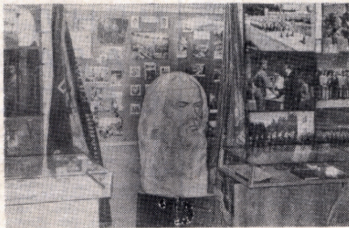
Музей получается хороший, очень много интересного, — таково мнение посетителей.

Вряд ли стоит останавливаться на актуальности экспозиций музея МХТИ в деле воспитания чувства патриотизма у студентов и сотрудников института, у выпускников менделеевцев. Этот музей нам показал старший преподаватель С. С. Аралов. Музей еще только начинает работу. Еще многое из задуманного не воплощено на его стенах, стендах и витринах. Кропотливо, по крохам собираются документы, сведения об ученых, студентах, сотрудниках Менделеевки, ко-