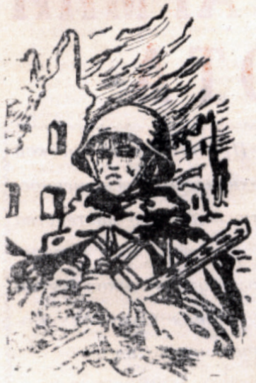
К 60-ЛЕТИЮ ОБРАЗОВАНИЯ СССР