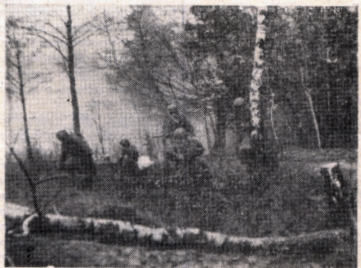
И стало светло, как днем...

мы тянем пулеметы: для боеприпасов нам повозку дали, но для пулеметов не хватило. А зенитный пулемет — это не «максим». Но тянем. И тут немец ударил по нам. Лошадь метнулась. Я упал и прикрылся винтовкой.