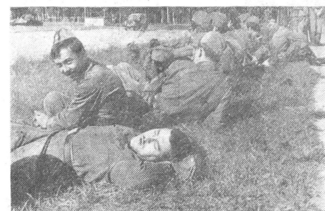
Минутный отдых перед большим концертом.