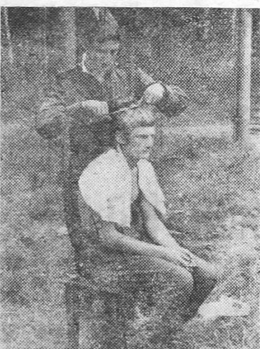
Теперь мы все можем сами.