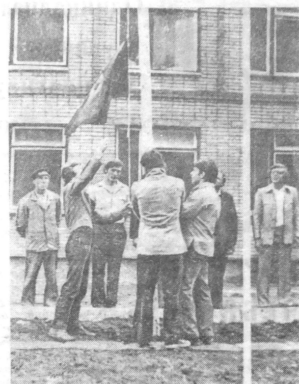
Усть-Кут — место дислокации и трудовых свершений ССО «Каскад». Открытие лагеря.