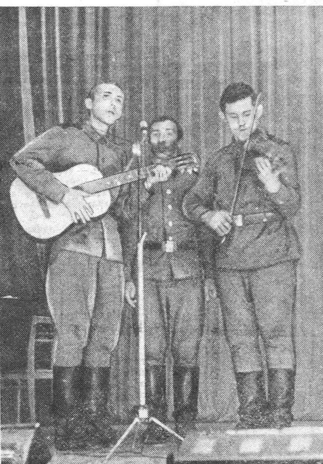
...долго не смолкали аплодисменты