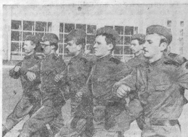
Строевая подготовка — основа всей военной учебы.