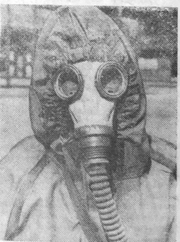
Послало фотографию маме...