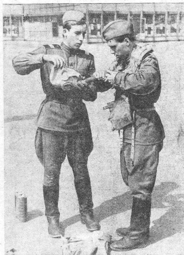
Сейчас вместе во всем разберемся.