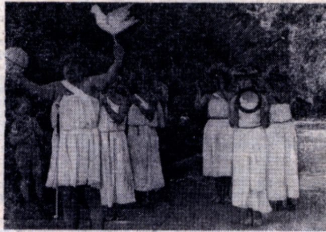
О, спорт — ты мир!