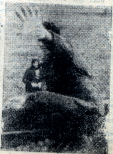
Быстрее! Темп! Проставаем...