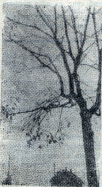
Фото М. ЗУБО (вечерний факультет)