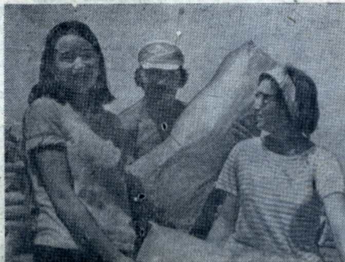
Астрахань — 74