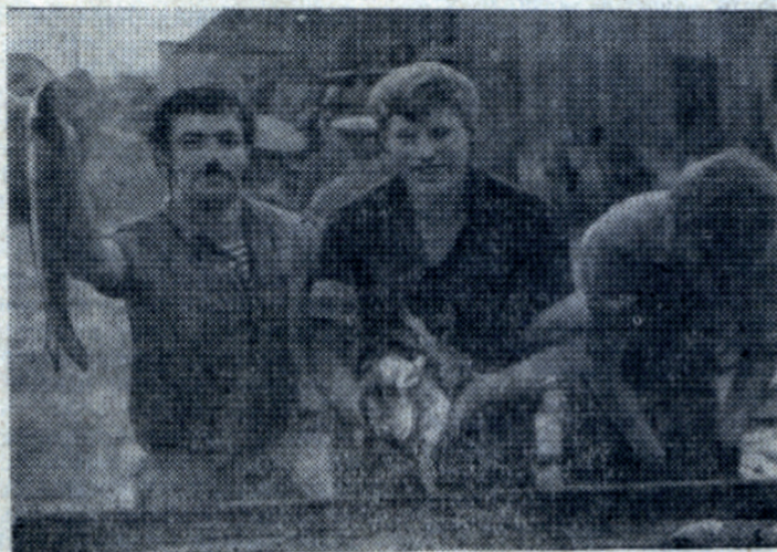
Сахалин — 74