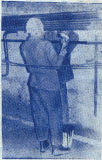
Работа в подвале жилого дома. «Москва-79» ИФХ.

Дальнейшее развитие получили специализированные отряды. Как и в предыдущие годы, на Московской парфюмерно-кос-