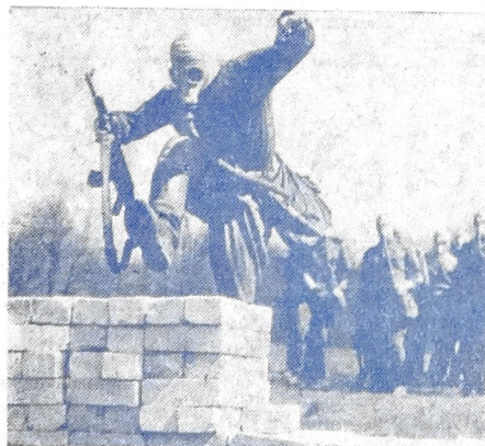
ВСК — это вам не ГТО...

Первые занятия и тренировки показали, что нам предстоит еще много работы, чтобы понастоящему подготовиться к сдаче норм военно-спортивного комплекса и ГТО. Основное внимание курсанты должны сосредоточить на кроссовой подготовке к марафону-броскам, на гимнастических упражнениях, на преодолении полосы препятствий. Занятия и тренировки должны проходить с полной отдачей, и только тогда вы сможете выполнить требования, предъявляемые к воину-спортсмену.