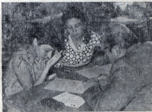
Вступительный экзамен по химии.

каждой школе раз в год). Это может быть также олимпиада, экскурсия на выставку «МХТИ — народному хозяйству», организация вечера отдыха с демонстрацией слайдов об институте и выступлением агитбригады. И, конечно же, кружки химии, которых должно быть как можно больше от каждого факультета. Это, пожалуй, самая эффективная форма работы, ибо она предусматривает индивидуальную работу со школьниками.