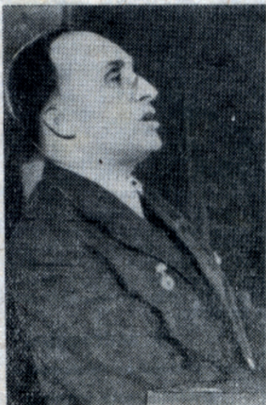
Академик А. Н. Несмеянов