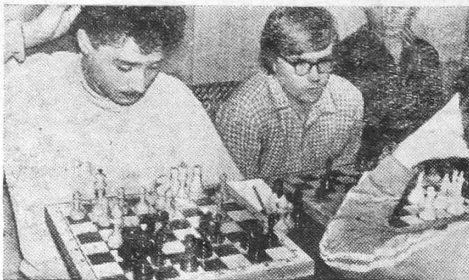
В шахматном клубе в общежитии «Тушино».