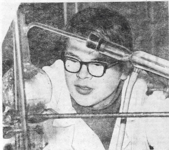
Лаборатория органической химии. Идет эксперимент.