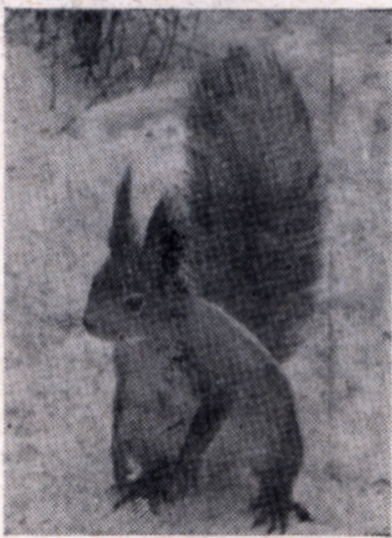
За хлебом насущным.

дил своих ближайших соперников А. Бойцова (И-21) и Н. Ермошина (И-26).