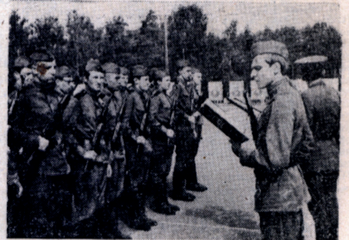
Студенты-менделеевцы приносят клятву верности Родине.

«Прочитай книги Л. И. Брежнева, — пишет один из студентов ИФХ, — начинаешь смотреть на всю историю нашего государства другими глазами, начинаешь понимать, какими жертвами завоевана победа над фашизмом, с каким трудом вырабатывается хлеб и возрождается разрушенное... чувствуешь огромную любовь автора к Родине, к ее городам и селам, заводам и, конечно же, к людям, которые создают все это во имя счастья и мира на