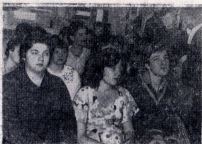
На заседании Интерклуба.

В читальном зале справочно-информационных изданий ИЦ (комната 18) с 17 по 22 мая открыта выставка научных публикаций из фонда ГПНТБ СССР по теме «МЕХАНИЗМ ХИМИЧЕСКИХ РЕАКЦИЙ». Выставка открыта с 10.00 до 19.00. Справки по телефону: 258-97-44.