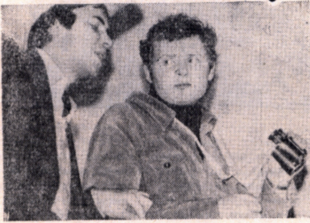
На сцене агитбригада ХТП факультета.

Повышенный интерес студентов к фестивалю «Осень — МХТИ-81» объясняется, с одной стороны, популярностью агитбригад, с другой стороны, подтверждает то, что агитбри-