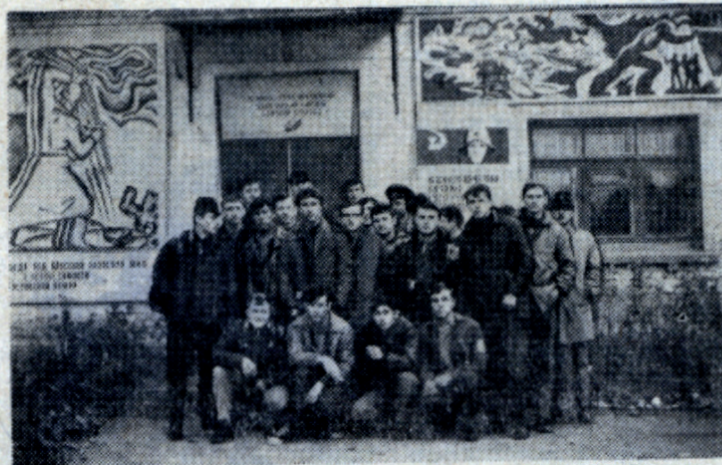
Учебный взвод О-23 в народном музее боевой славы.