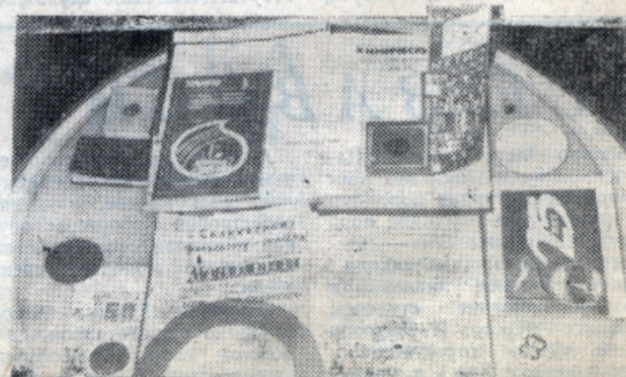
Экспонаты Музея боевой и трудовой славы МХТИ им. Д. И. Менделеева.