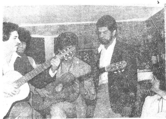
Доминиканские студенты исполняют песни своей страны.