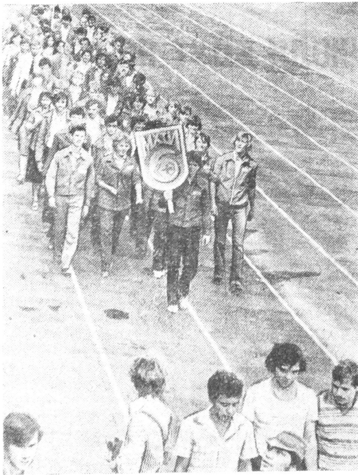
Колонна бойцов ССО МХТИ им. Д. И. Менделеева на спортивном фестивале ССО-81.