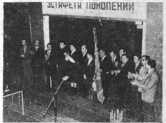
Живая связь времен...