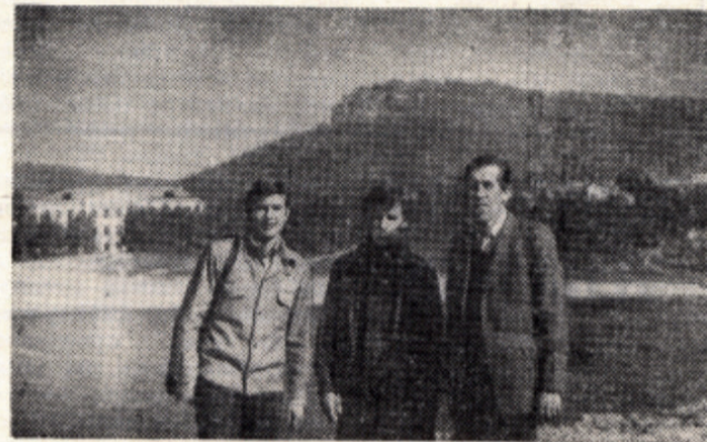
На иркутской земле. Август 1981 г.