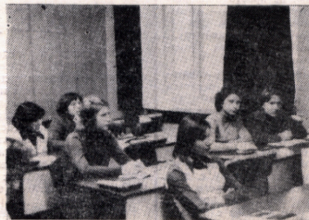
Заинтересованно, по-деловому проходят семинарские занятия.