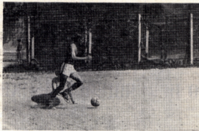
Спорт в стройотрядах всегда в большом почете.