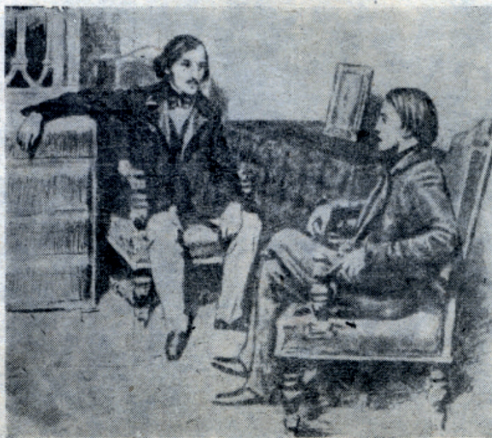
Н. В. Гоголь и В. Г. Белинский

Дорого русскому сердцу имя Гоголя... Никто лучше его не понимал всех оттенков русской жизни и русского характера, никто так поразительно верно не изображал русского общества.