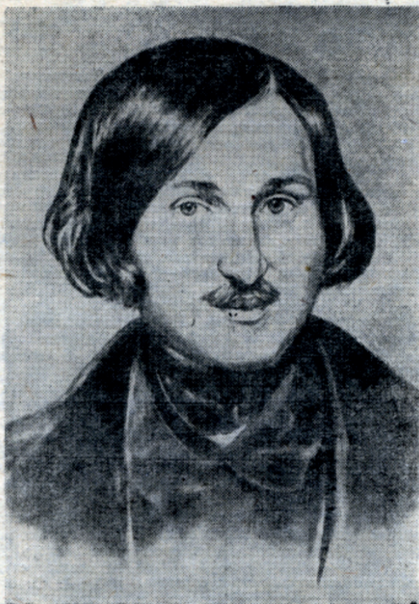
Николай Васильевич Гоголь

В 1842 году была издана первая часть «Мертвых душ» и вышло первое собрание сочинений писателя.