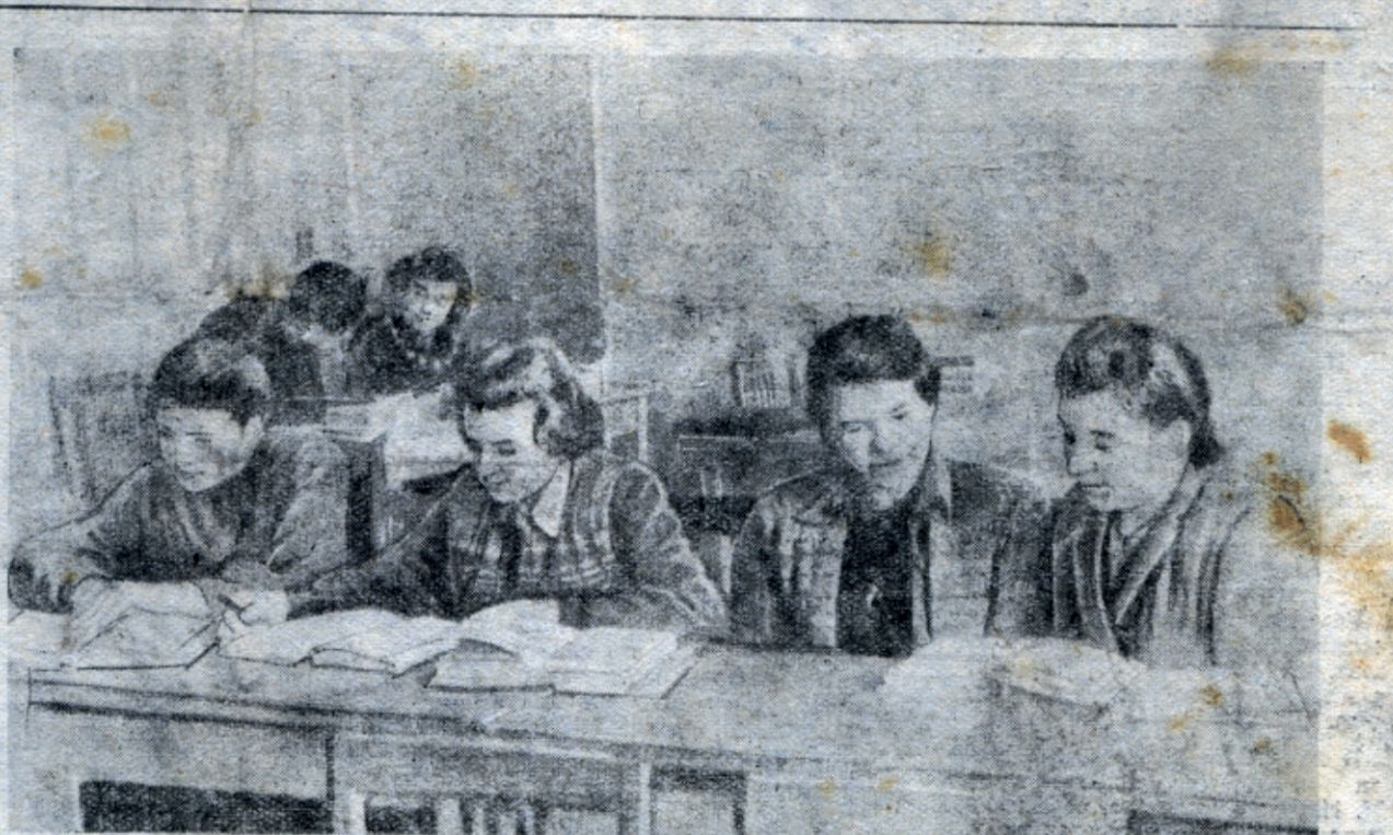
В кабинете иностранных языков.