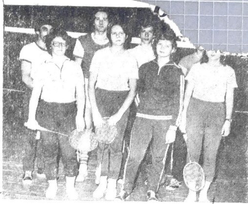
Лучшие ракетки МХТИ 1979 г.

Здоровье народа — самое дорогое достояние нашего общества. Профком, местком, деканаты должны взять под контроль график флюорографического обследования студентов и сотрудников.