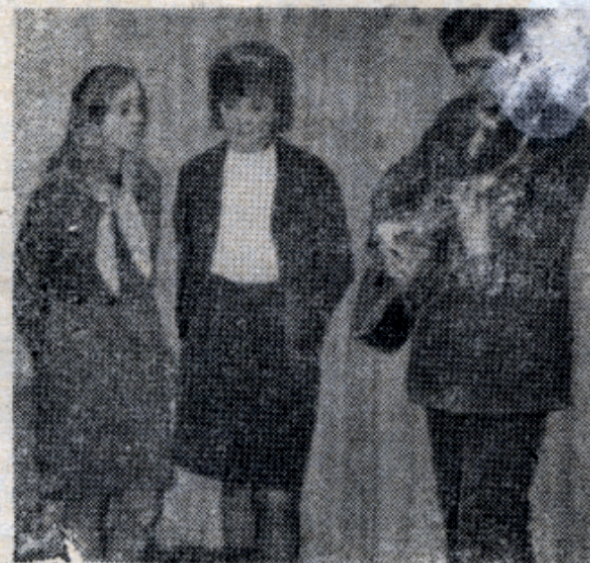
СЛАВНАЯ ТРАДИЦИЯ — ВЕЧЕРА ПЕРВОКУРСНИКОВ!

Тихина. Темный зал. Яркий луч прожектора падает на сцену. И тут... появляются русские воины времен князя Игоря. Они приветствуют первокурсников силикатного факультета.