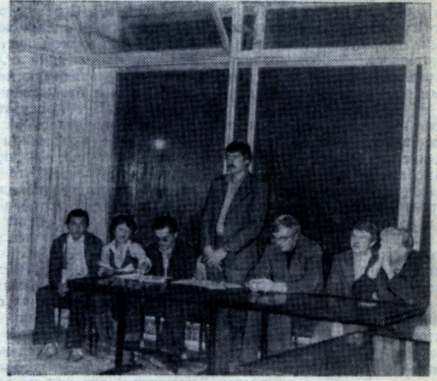
На отчетно-выборной конференции студсовета ИФХ факультета в общежитии.

тии, не потерялся в лабиринте его коридоров, а мог найти интересное для себя дело. Возможность для всего этого у нас есть. За прошедший год профком нашего факультета приобрел музыкальную аппаратуру для проведения вечеров и дискотек, спортивный инвентарь, призы для награждения победителей спортивных турниров. Ребята оборудовали и оформили комнаты для работы клуба и кафе, завершается оформление шахматного клуба и факультетского красного уголка. Много поработать придется в этом году нашей редколлегии и фотографам.