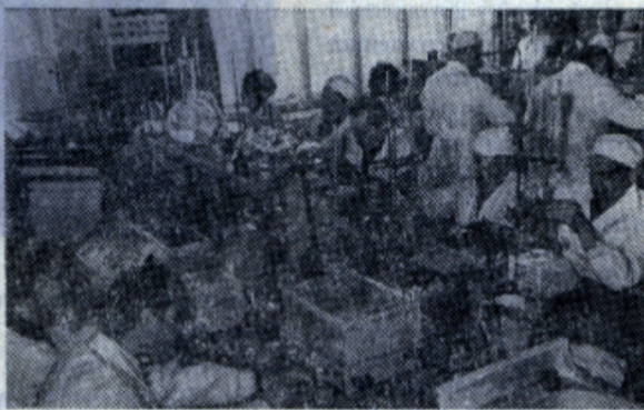
Современное научное исследование — плод коллективного труда.

Первый конкурс, как это объявлено совместным приказом-постановлением Министерства высшего и среднего специаль-