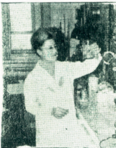
Сначала надо попробовать «на себе»...