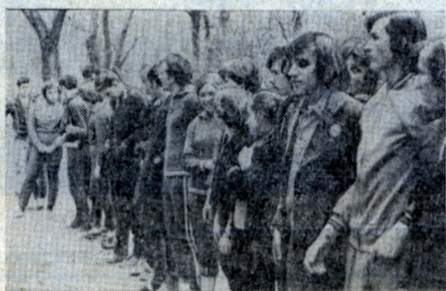
Участники традиционной эстафеты ИФХ факультета построены для награждения