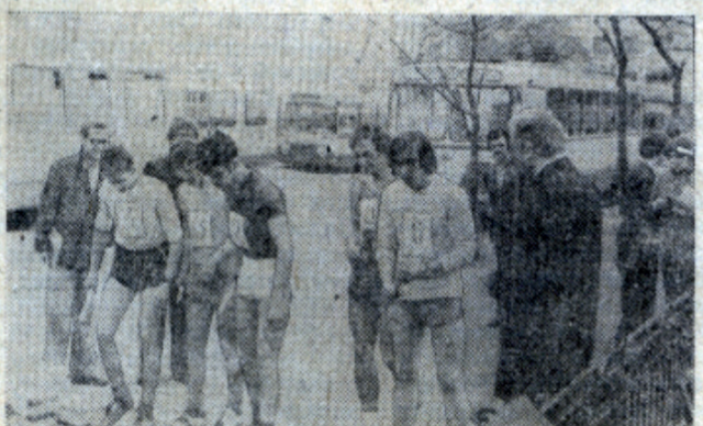
До старта эстафеты остаются секунды...

На физико-химическом факультете каждую спортивную весну встречаются легкоатлетическая эстафетой на кубок комитета ВЛКСМ.