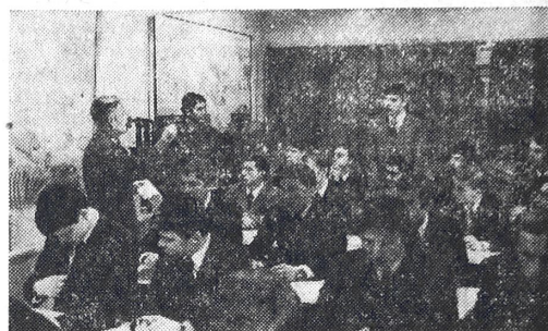
В час политико-воспитательной работы

ежемесячно выходит радиогазета, выпуск которой, как правило, бывает приурочен к важнейшим событиям в жизни страны и ее Вооруженных Сил.