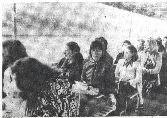
На теплоходе по Москве-реке