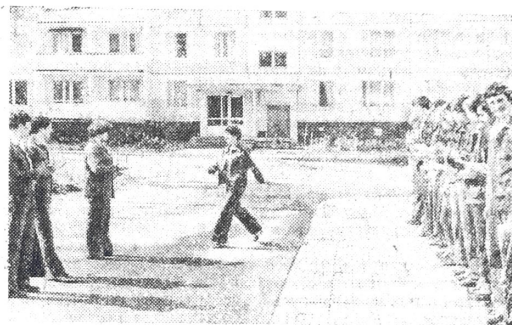
«Москва-79» ИФХ. Торжественное вручение комсомольских путевок