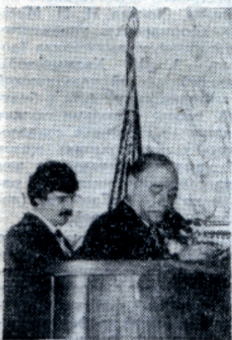
Коллектив института поздравляет зам. министра высшего и среднего специального образования СССР Н. Н. Софинский.

4 апреля состоялось торжественное собрание, посвященное подведению итогов социалистического соревнования. В президиуме: зам. министра высшего и среднего специального образования СССР Н. Н. Софинский, председатель Горкома профсоюза работников просвещения, высшей школы и научных учреждений В. М. Яков-