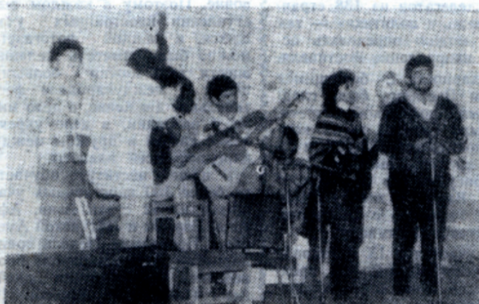
Зрители долго не отпускали со сцены кубинских студентов.