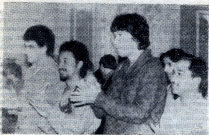
Мероприятия недели солидарности всегда собирали многочисленную аудиторию.