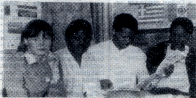
День Африки в интерклубе. Вопросы... Ответы...