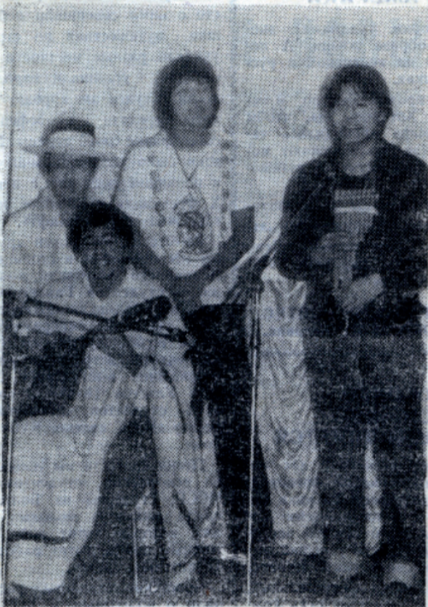
Поют боливийские студенты.