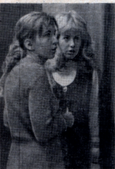
Что там ждет впереди?..

практическую помощь оказывают студентам офицеры-преподаватели, которые проводят консультации и обращают внимание на самые трудные и сложные вопросы. Студенты, сдававшие этот экзамен, считают, что не стоит все время сидеть дома над конспектами, что обязательно нужно приехать на военную кафедру и побывать на консультациях преподавателей, обязательно самим поработать с приборами.