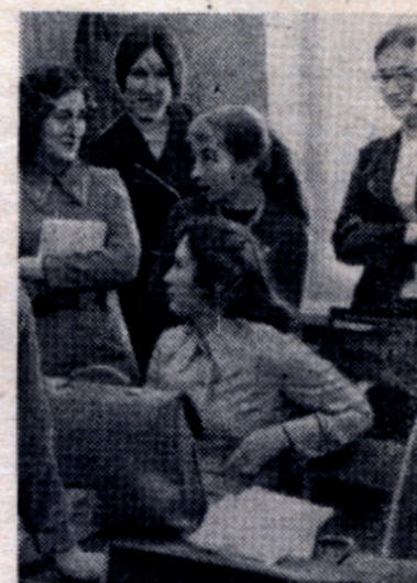
Хорошие оценки — хорошее настроение.

Хочется пожелать всем преподавателям кафедры всего