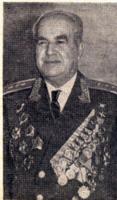
И. И. Людников.

великой битвы на Волге. «Остров Людникова»... Нет на карте такого острова, да и не может им быть земля, лишь с одной стороны омываемая водой. И все-таки этот