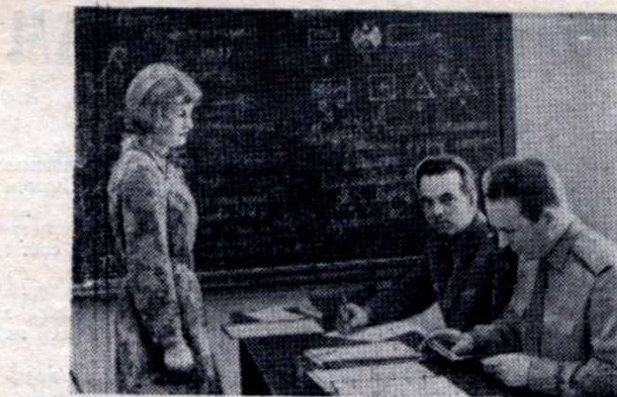
Лучше один раз сдать самому...

«Первый в жизни госэкзамен позади. 5 минут назад получе-