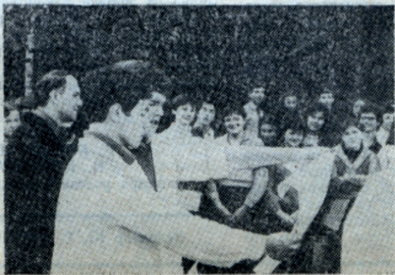
Посвящение. Страшная клатва.